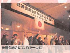
後援会総会にて、心をつなぐ