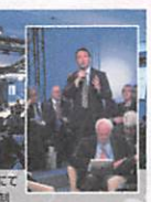
ブリュッセルフォーラムにて 中国の膨張主義を牽制