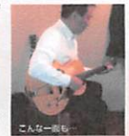
こんな一瞬も 地元のおぼんざい隊で ギター弾き語り