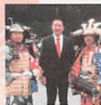
時代劇で橋本正成役と