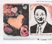
そっくりキャラ弁の差し入れ ありがとうございます！