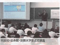
同志社・立命館・京大など講演