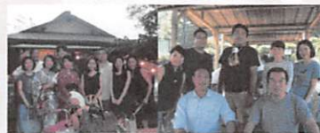
官歴の輪の中に加えていただきながら、地域の課題やご意見を しっかりと伺っています。