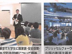
東京で大学生に国家情・安全保障・ 外交防衛問題について講演