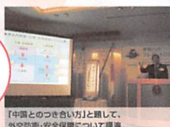
「中国との付き合い方」と題して、 外交防衛・安全保障について講演