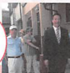
早朝に青空国政報告会