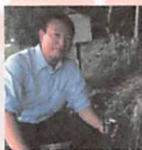
口丹渡にて、 地域の課題を伺う。