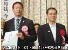
大畠国交相(当時)へ国道423号線整備を陳情