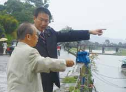
嵐山地区の桂川河道整備を実現