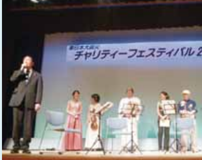
被災地支援として手づくりのチャリティフェスティバルを開催