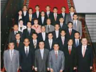
経済産業大臣政務官として政権に参画