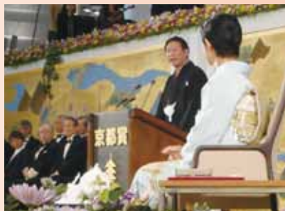
京都賞授賞式に首相代理として祝辞