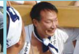
皆さんと一緒に汗を流して、コミュニティづくりに参加しています