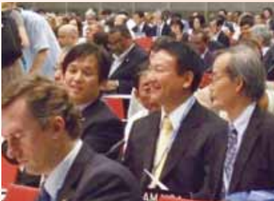
気候変動枠組条約締結国会議 (COP17) に出席