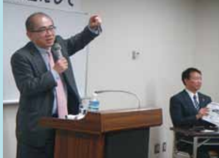
溝畑観光庁長官との観光政策勉強会を開催