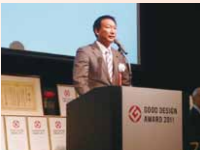
グッドデザイン賞授賞式で挨拶