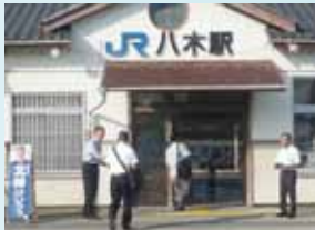
街頭演説やミニ集会で、皆様のご意見を直接うかがっています