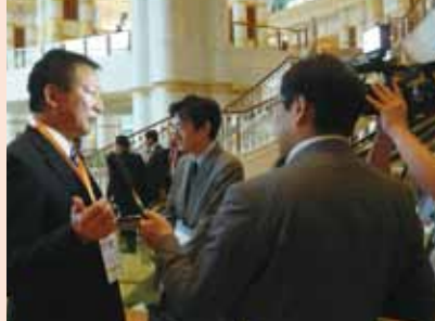
ブルネイEASサミットで取材を受ける