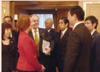
ギラード豪首相と友好を深める