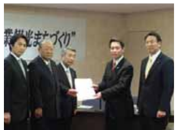
国道423号について前原国交大臣(当時)に要望。