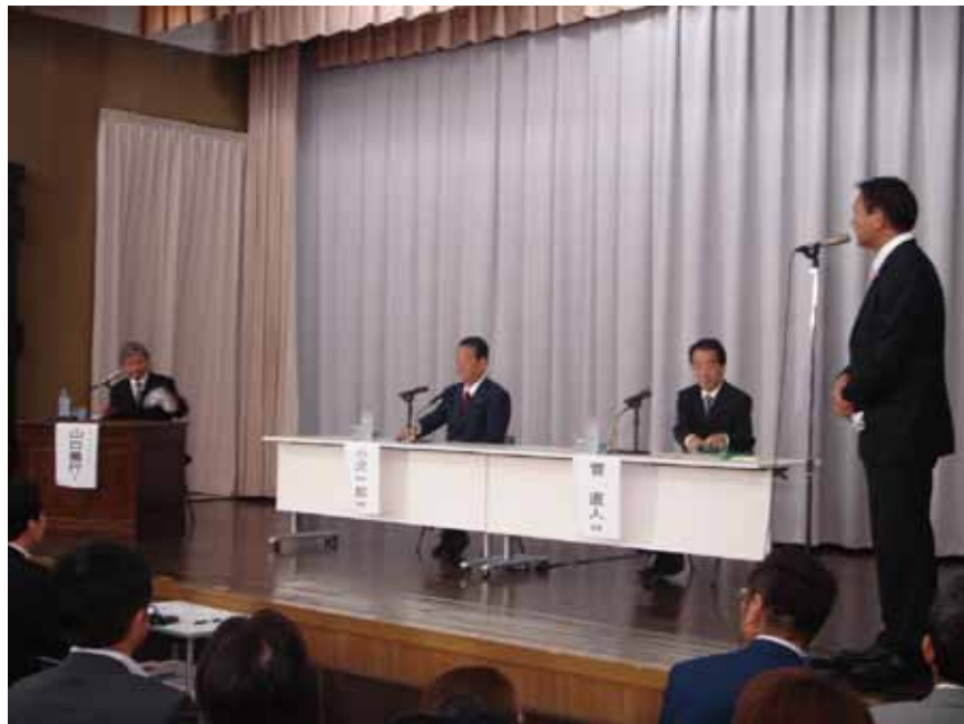
民主党代表選挙では「政策論議による代表選を実現する会」を有志議員らと立ち上げ、初めての「議員による公開討論会」を開催しました。