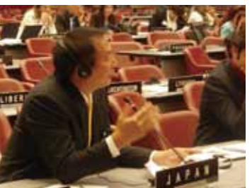
IPU (列国議会同盟) 総会に日本の議会代表団長として出席、議員外交を展開。