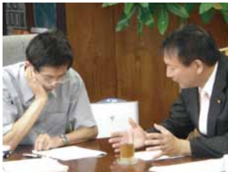
篠原農水副大臣と京丹波町の「鶏舎撤去」問題について真剣に話し合いました。