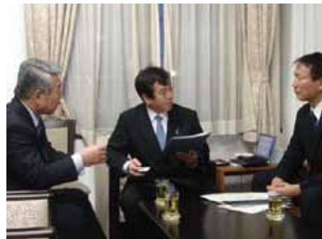
栗山亀岡市長とともに原口総務大臣(当時)へ「地方財政拡充」の要望を行いました。