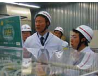
経済産業委員として現場視察。「現場主義」を忘れません。